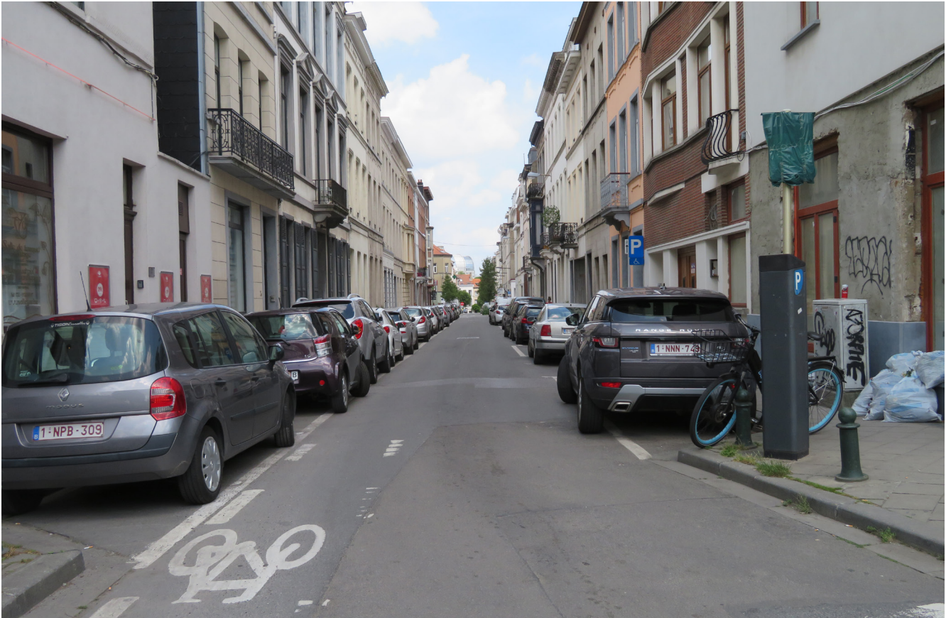
La rue du Conseil, une longue ligne droite