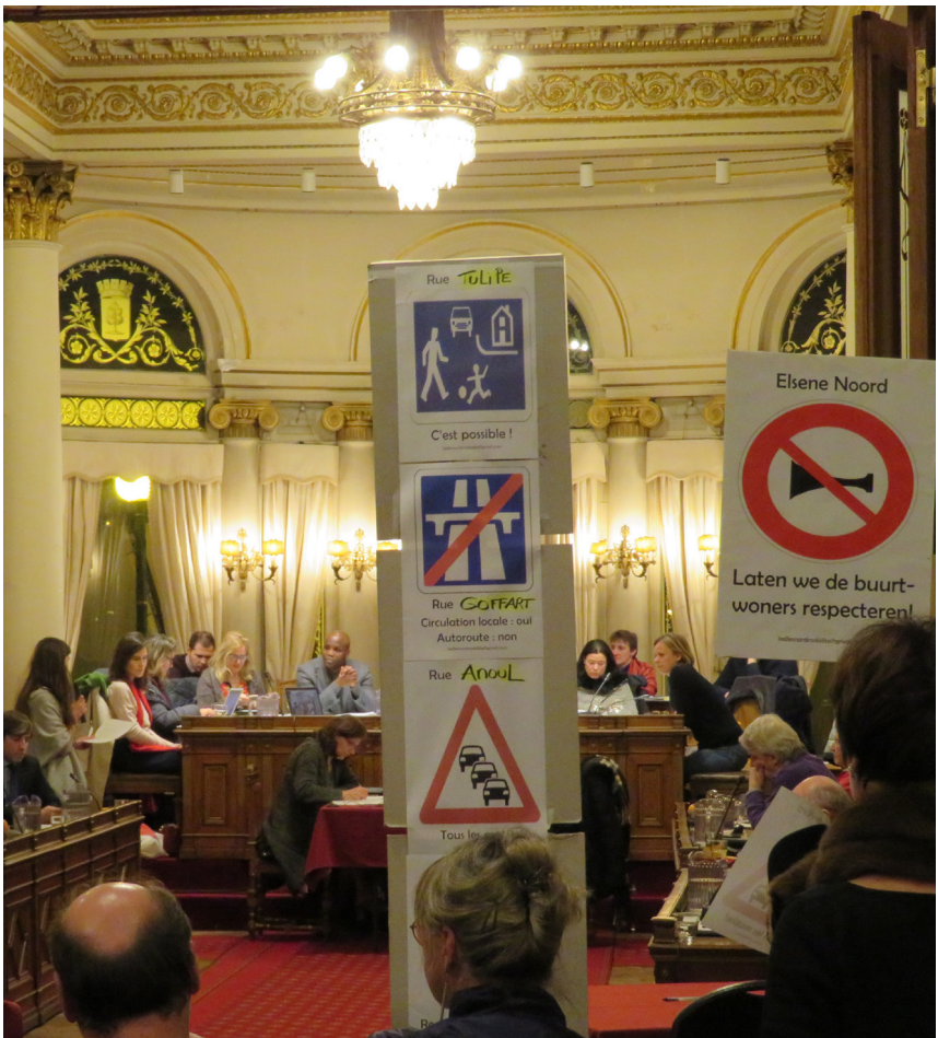
Deuxième interpellation citoyenne au Conseil Communal d'Ixelles - 22 février 2018