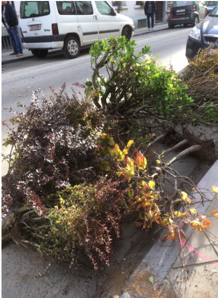
Récupération des plantes place Fernand Cocq (novembre 2018)

citoyennes, certaines dans une opposition forte au projet XL for people (abattage des arbres, remise en cause des aménagements prévus), d'autres plus consensuelles. De l'avis même des échevins rencontrés, en particulier sur les questions de mobilité, l'absence d'emails de protestation est perçue comme une approbation des décisions politiques prises. Nous trouvons cela dommage comme vision de la participation citoyenne aux décisions politiques. Nous voulons un autre type de participation. C'est pourquoi le Comité de la rue du Conseil a voulu d'emblée travailler avec les politiques. Non seulement parce que des autorisations sont nécessaires pour toute action dans l'espace public, mais aussi, et surtout, car nous voulions que le politique fasse sa part du travail. Un genre de « donnant-donnant » : nous citoyens nous nous mobilisons pour rendre la rue plus sûre, plus verte, plus propre, mais on a besoin de votre aide. Nous attendons des pouvoirs publics qu'ils autorisent certaines installations (la rue « en S »), qu'ils soient plus actifs au niveau de la propreté ou de la répression des incivilités. Les politiques (Echevins en charge des Contrats de Quartier, de la Mobilité, des Espaces publics) ont été très accessibles, ont réagi positivement et ont encouragé la mobilisation des habitants de la rue pour ce projet.