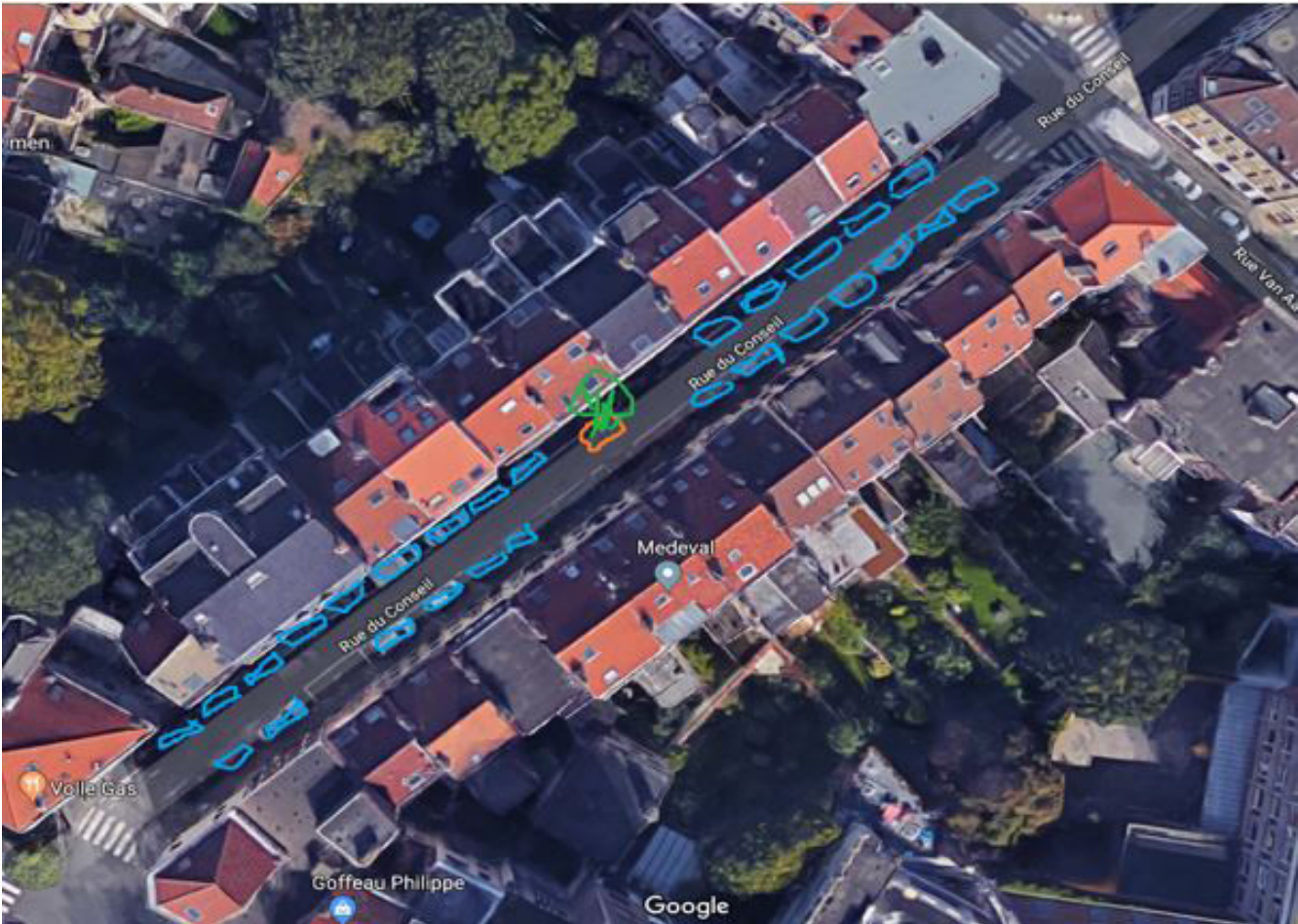
Simulation d'aménagement de la rue en « S » par l'installation de bacs végétalisés pour réduire la vitesse du trafic