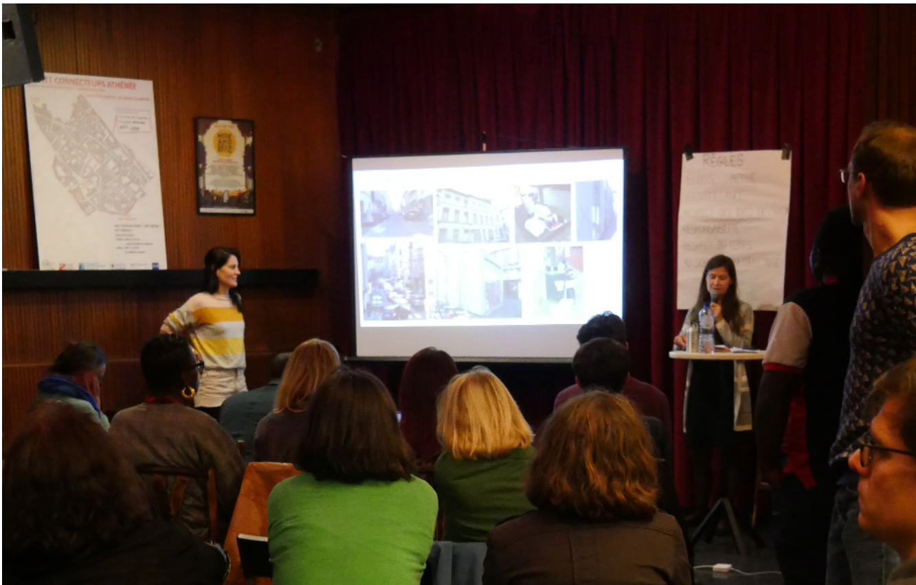
Présentation du projet « La Rue du Conseil a des idées » à l'Assemblée de quartier du 26 septembre 2018 consacrée à la sélection des projets qui seront soutenus par le budget participatif du projet « Connecteurs ». Le projet est sélectionné et obtient un soutien financier de 5200 €.