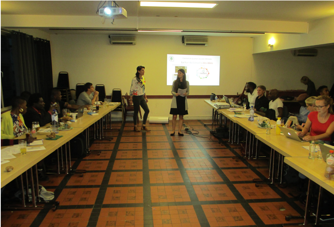
Présentation du projet « La Rue du Conseil a des idées » à la Table des Connecteurs (12 septembre 2018). Les Connecteurs donnent des conseils au collectif pour améliorer le projet avant de le présenter à l'Assemblée de quartier.