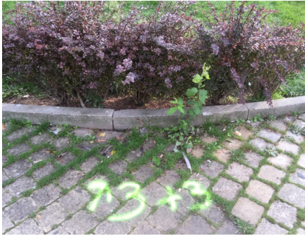
Sélection des plantes place Fernand Cocq